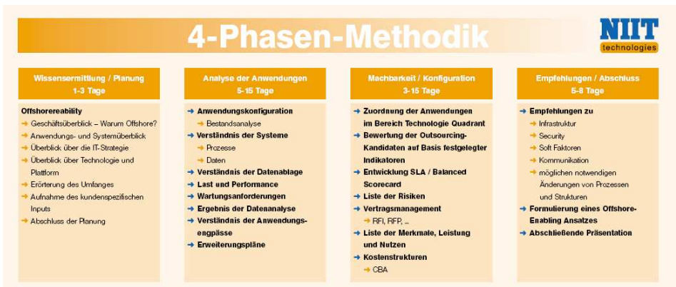
Abbildung 2: 4-Phasen-Methodik

NIIT TRAQ basiert auf 15 Jahren Erfahrung bei mehr als 800 Kunden in 44 Ländern, was die Zusammenarbeit und die effektive Nutzung von Offshore Modellen angeht. NIIT TRAQ ist in vier einzelne Phasen unterteilt, die auf Ihre individuellen Bedürfnisse zugeschnitten werden. Herzstück von NIIT TRAQ ist ein Portfolio Analyse Tool zur Identifizierung sourcingfähiger Anwendungen und zur Bewertung Ihrer Wirtschaftlichkeit. Dabei werden alle relevanten Daten über die Anwendungen erfasst. Anhand von Eignungs- und Kostenkriterien wird für jede Anwendung auf Basis eines ausgeklügelten, von erfahrenen Beratern entwickelten Berechnungsverfahrens die Eignung und Wirtschaftlichkeit hinsichtlich Outsourcing ermittelt. Hierzu gehören z. B. die Wartungskosten einer Anwendung nach einem Outsourcing oder eine Analyse der IT Strukturen und Prozesse hinsichtlich der Kompatibilität mit einem Global Sourcing Modell.